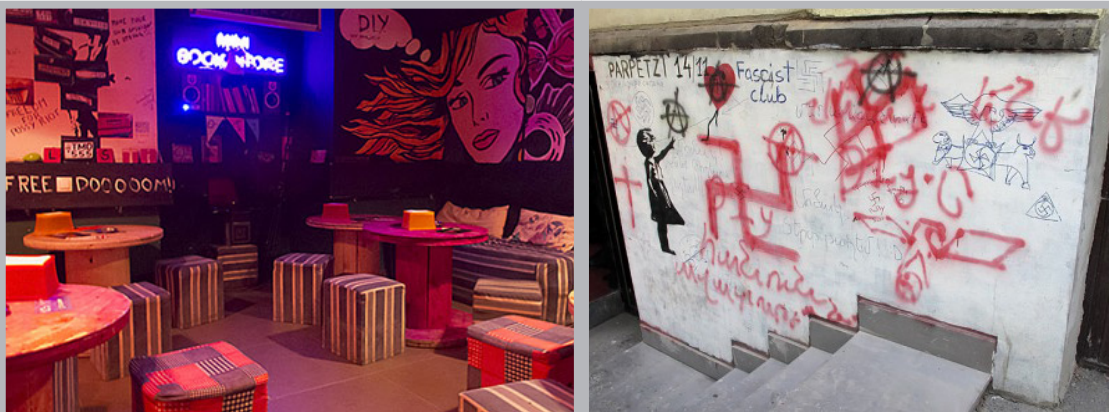
Դի-Այ-Ուայ ակումբը Երևանում. մինչ ատելության հիմքով հանցագործությունը և դրանից հետո

Օգանեզովան պնդում է, որ ոտնահարվել են մի շարք իրավունքներ, որոնք երաշխավորված են Մարդու իրավունքների և հիմնարար ազատությունների պաշտպանության մասին եվրոպական կոնվենցիայով: Մասնավորապես, նա նշում է, որ պետությունը, որպես պատասխանող կողմ, ոտնահարել է խոշտանգումների կամ անմարդկային կամ նվաստացնող վերաբերմունքի կամ պատժի չենթարկվելու իրավունքը (հոդված 3), անձնական և ընտանեկան կյանքի իրավունքը (հոդված 8), ինչպես նաև արտահայտվելու ազատության իրավունքը (հոդված 10): Լրացուցիչ բողոքներ են ներկայացվել կոնկրետ իրավունքների ոտնահարումների, ազատությունների և անխտրականության արդյունավետ մեխանիզմներ չկիրառելու համար: