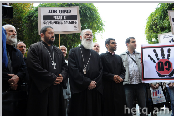
Ծայրահեղական խմբերը և Հայ Առաքելական եկեղեցու ներկայացուցիչները բողոքում են ընդդեմ գենդերային հավասարության

2013թ-ի մայիսին ՀՀ Ազգային ժողովը ընդունեց «Կանանց և տղամարդկանց հավասար իրավունքների և հավասար հնարավորությունների մասին» օրենքը: Օրենքի ընդունումից երկու ամսի հետո, օրենքի ընդունումը դարձավ բուռն քննարկումների թեմա: Ավելին, այս քննարկումներն ավելի թեժացան և սրվեցին օգոստոսի վերջին երկու շաբաթների ընթացքում, երբ հայկական հասարակության բոլոր ոլորտները